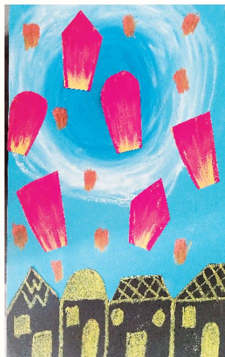
小记者:张琳儿 三(6)班 辅导老师:吴艳侠