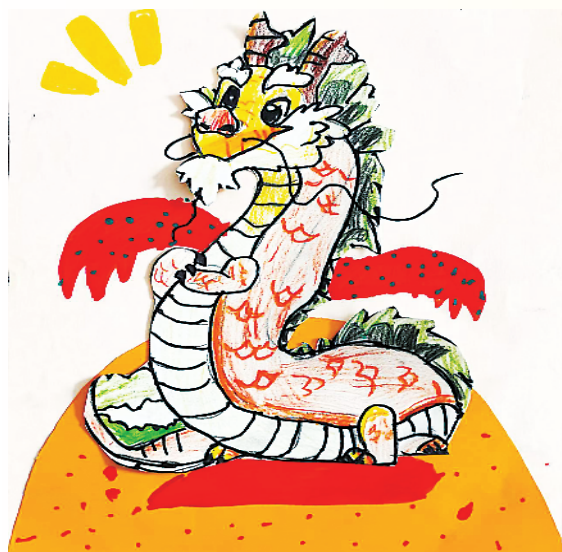
小记者:王晔 二(4)班 辅导老师:梁爽