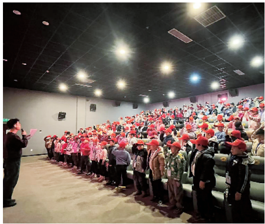
小记者聆听入团第一课。

10时,免费观影活动开始,小记者们睁大双眼,聚精会神享受着“光影育人”项目带来的独特体验。