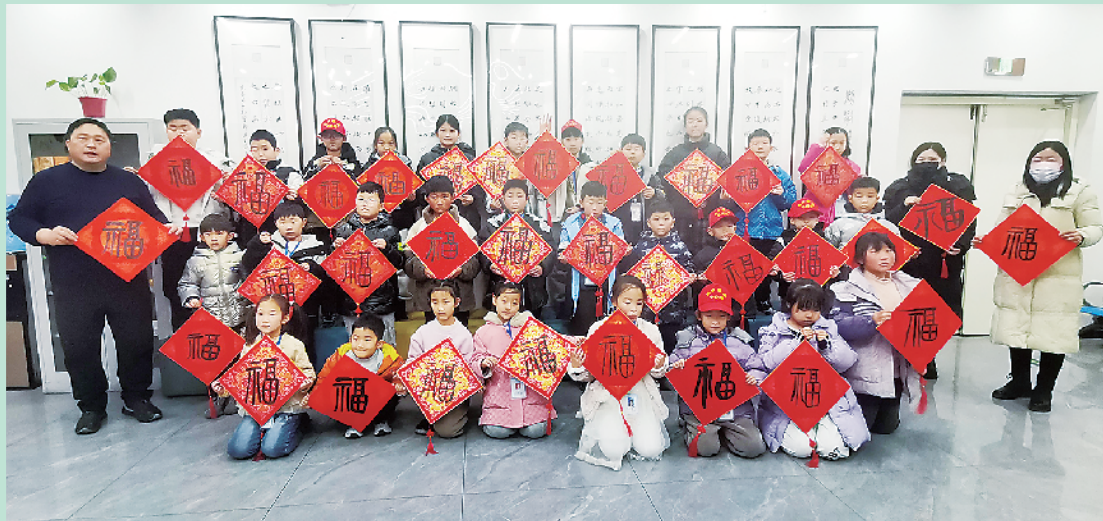
小记者和老师拿着“福”字合影留念。