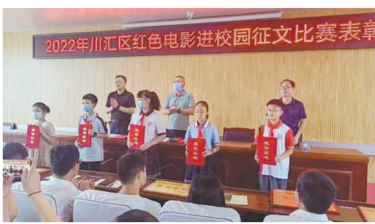
7月7日下午,川汇区教体局举行“观看红色电影,书写爱国情怀”红色电影进校园征文比赛表彰会。该活动历时4个多月,全区中小学生学习积极参与,共征集稿件868篇,分小学、初中、高中三个组,经专业人员认真评选,评出获奖作品特等奖35名、一等奖83名、二等奖161名,先进学校10所,优秀组织奖10个。

二要严格落实校园疫情防控常态化措施,教师及涉校服务人员实行全封闭管理,坚持“日报告”“零报告”制度,确保校园平安。三要精准排查近期从上海、无锡、郑州、镇平、泌阳返沈教师、涉校服务人员及共同居住人员,积极配合属地政府落实各项疫情防控措施。四要全力配合全县全员核酸检测,严格落实带班、值班、值守和AB角工作制度,时刻保持应急响应状态。五要加大宣传力度,充分利用钉钉、微信群、公众号开展健康教育,增强学生及家长防护意识,为全县疫情防控贡献教体力量。