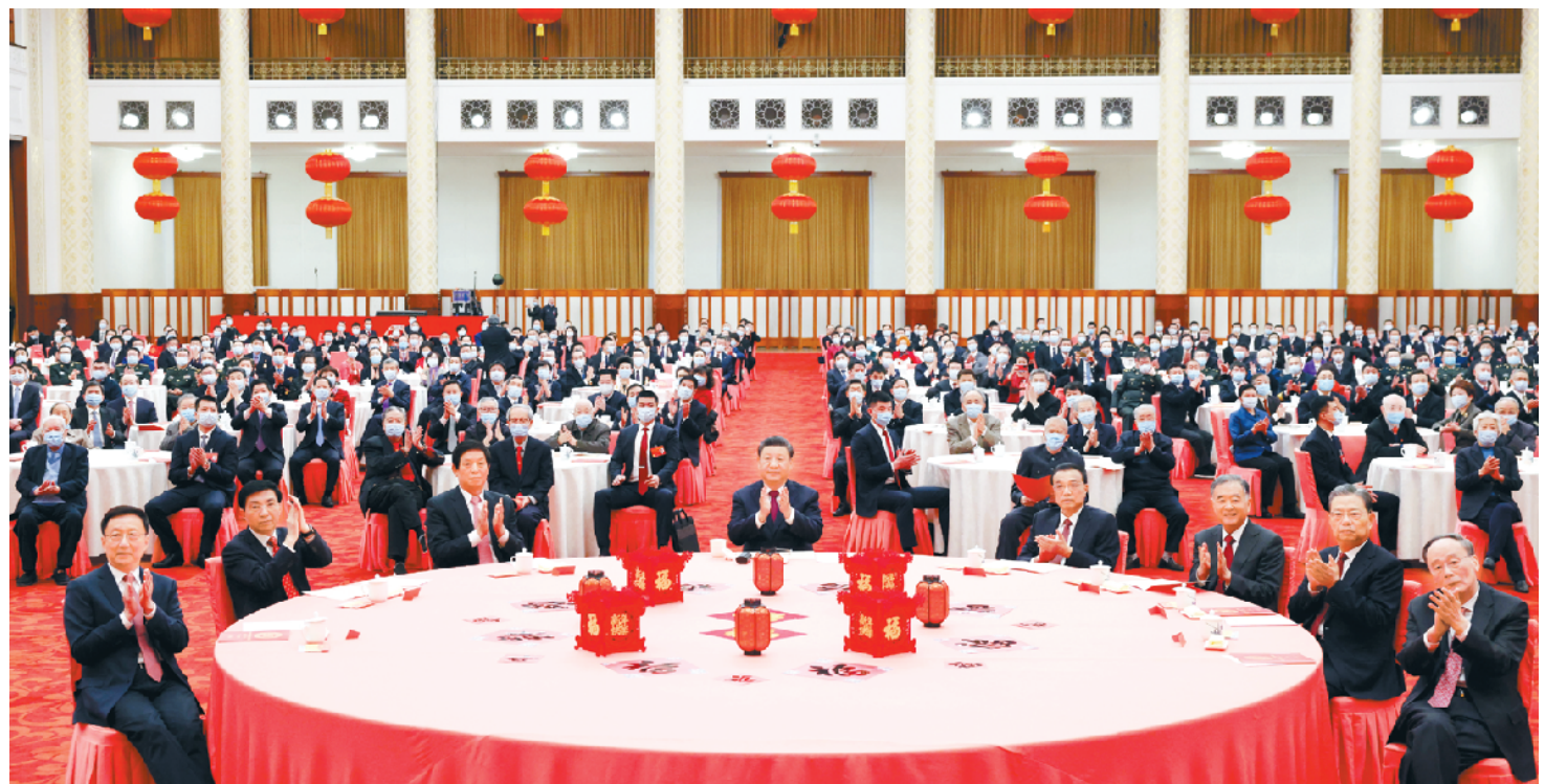
1月30日,中共中央、国务院在北京人民大会堂举行2022年春节团拜会。党和国家领导人习近平、李克强、栗战书、汪洋、王沪宁、赵乐际、韩正、王岐山等同首都各界人士欢聚一堂,共迎新春。

新华社北京1月30日电 中共中央、国务院30日上午在人民大会堂举行2022年春节团拜会。中共中央总书记、国家主席、中央军委主席习近平发表讲话,代表党中央、国务院,向全国各族人民,向香港特别行政区同胞、澳门特别行政区同胞、台湾同胞和海外侨胞拜年。 习近平强调,一百年来,党和人民取得的一切成就都是团结奋斗的结果,团结奋斗是中国共产党和中国人民最显著的精神标识。百年奋斗历史告诉我们,团结就是力量,奋斗开创未来;能团结奋斗的民族才有前途,能团结奋斗的政党才能立于不败之地。百年奋斗历史还告诉我们,围绕明确奋斗目标形成的团结才是最牢固的团结,依靠紧密团结进行的奋斗才是最有力的奋斗。我们靠团结奋斗创造了辉煌历史,还要靠团结奋斗开辟美好未来。只要14亿多中国人民始终手拉着手一起向未来,只要9500多万中国共产党人始终与人民心连心一起向未来,我们就一定能在